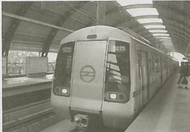
అనుబంధ వార్త విశేషాలలో సమగ్ర మాస పత్రిక

గౌరవ ముఖ్యమంత్రి తదితర ప్రభుత్వ పెద్దల అందడందలతో మెట్రో ప్రాజెక్టు అనేక అవరోధాలను అధిగమించి, భూసేకరణ పనులన్నీ దాదాపుగా పూర్తయ్యాయి. ఇప్పటి వరకూ ఎల్అండీటీ సంస్థకు 90శాతం భూములను అప్పగించడమైంది. ఉప్పల్ దగ్గర 100 ఎకరాలు, మియాపూర్ దగ్గర 104 ఎకరాలు అందజేయడం మైంది. మొత్తం మెట్రో ప్రాజెక్టు పనులను మూడు కాలిడార్లలో ఆరు దశలలో పూర్తి చేయాలని లక్ష్యంగా నిర్ణయించడమైంది. ఈ పనులన్నీ నిర్దేశించిన లక్ష్యం కంటే ముందుగానే ప్రారంభించి స్థానిక ప్రజాసౌకారిక అంకితమివ్వగలమని మా ప్రగ్రాధ విశ్వాసం. ఈ మేరకు మెట్రో పనుల పురోగతిని పరిశీలించేందుకు, తగిన సత్వర నిర్ణయాలు